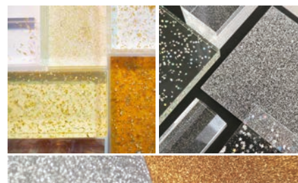
奥行のあるバリエーション豊富なラメ板

小ロットからの製作が可能で、現在ご注文いただいている80%以上がオーダーメイドです。印刷にはない深みと高級感、手作りならではの温かみのある表現が可能です。